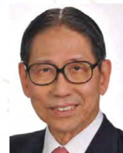
梁智鴻醫生 GBS, JP